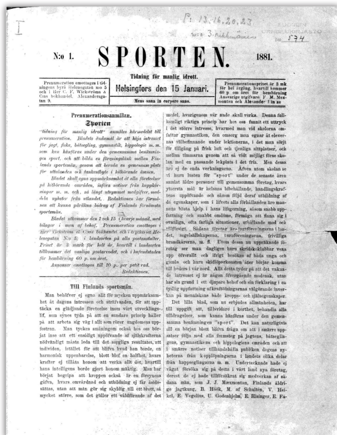
Suomen ensimmäinen urheilulehti oli ruotsinkielinen Sporten, jonka avausnumero ilmestyi 15.1.1881. Osana lehden vinjettiä luki Mens sana in corpore sano eli terve sielu terveessä ruumiissa.

Alkuvuosina ruotsinkieliselle yläluokalle suunnattu ja lehden kanteen kirjautusti miesten urheiluun (tidning för manlig idrott) keskittynyt Sporten käsittelee muun muassa metsästystä, kalastusta ja purjehdusta. [8] [9] Lehden toimituspolitiikka oli sävyllään opettavaista ja tulosoitoitunutta. Journalistiset mallinsa se haki Ruotsista. [10] Heti Sportenin avausnumerossa sen tavoitteeksi kerrottiin kiinnostuksen lisäämi-