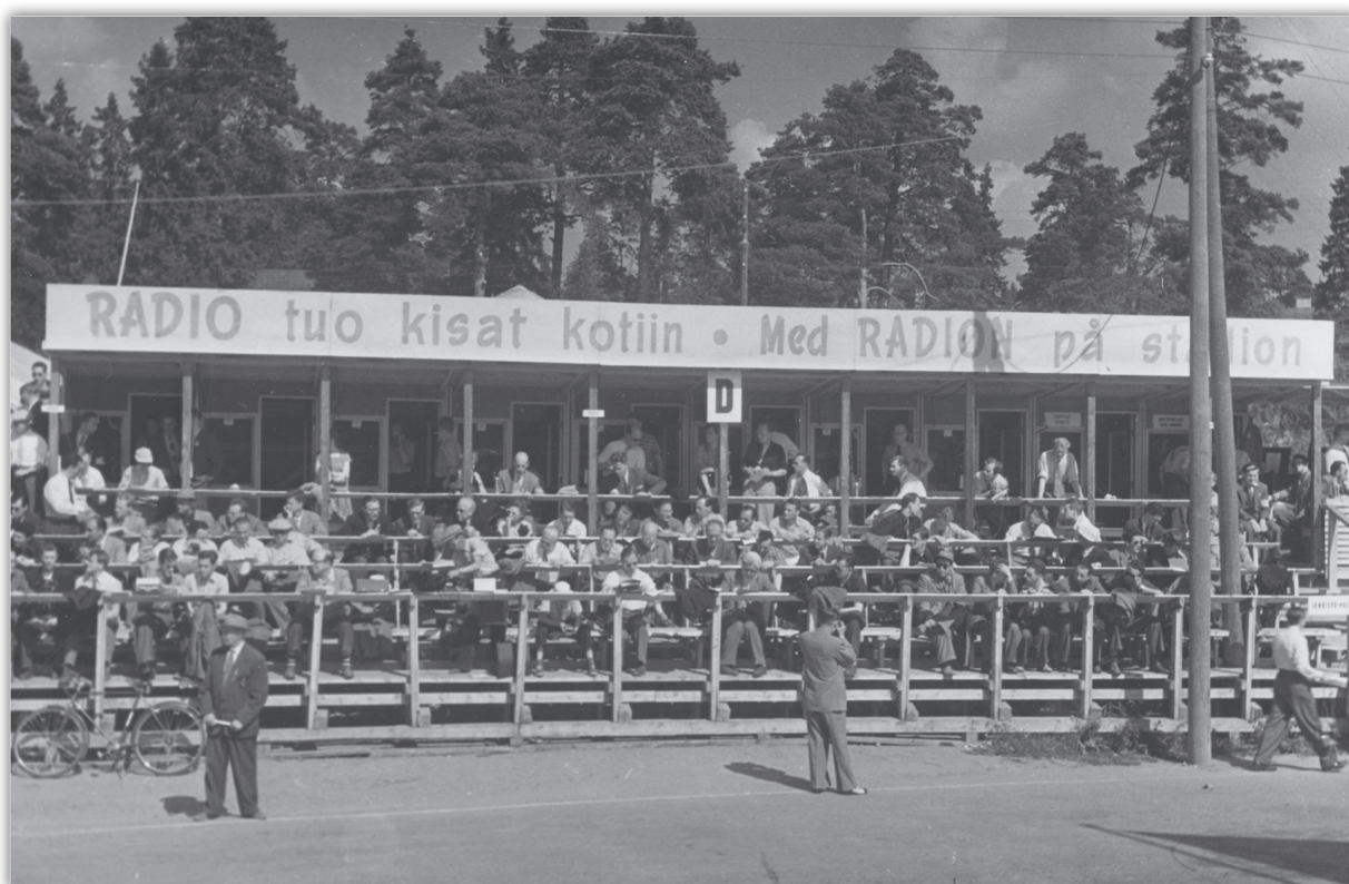
Urheilutoimittajia työskentelemässä Helsingin vuoden 1952 olympiakisoissa maantiepyöräilyreitillä varrella. Teksti "RADIO tuo kisat kotiin" oli näkyvästi esillä kisojen suorituspaikoilla.

muiden sanomalehtien sivuilta pois jääneiden sisältöjen raportointi. [57] Pian urheiluraportoinnin muotoa joutuivat pohtimaan myös päivälehdet, sillä mediakentälle ilmestyi nopeuden merkitystä korostanut uusi peluri, radio. [58]