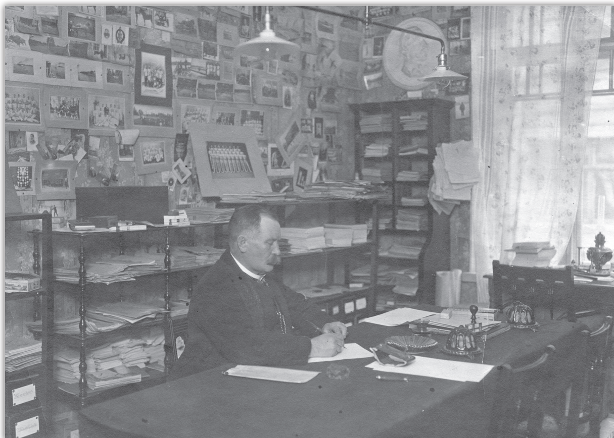
"Suomen urheilun isäksi" nimetty, Helsingin yliopiston voimistelulaitoksen opettaja, Ivar Wilskman (1854-1932) Urheilulehden toimitustyössä vuonna 1908.

Suomen Urheilulehti oli sen varhaisvuosina kirjaimellisesti Wilskmanin lehti, sillä hän kirjoitti valtaosan sen jutuista ja maksoi myös kulut omasta kukkarostaan. Toimitustyö tapahtui Wilskmanin kotona, mistä käsikirjoitusliuskat vietiin kirjapainoon. Kun lehdet oli painettu, ne tuotiin hevoskyydillä takaisin Wilskmanin kotiin, missä koko perhe osallistui lehden postittamiseen. [20]